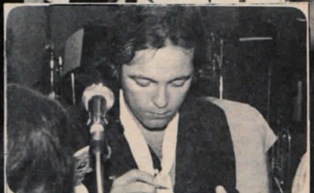
"Pedro Navaja" lo consagró definitivamente.

La letra de las canciones de Rubén Blades están salpicadas de un profundo contenido social.