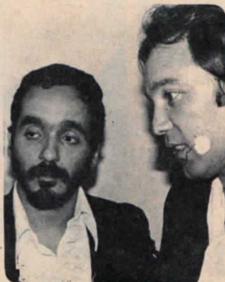
El binomio musical más acreditado actualmente, dentro de la salsa: Willie Colón y Rubén Blades.

-¿Cómo está tu vida, sentimentalmente hablando? le inquirimos.