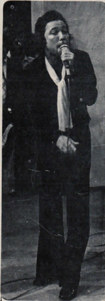
El héroe del día, Rubén Blades, admirado por el público venezolano.

Sufre de sinusitis crónica (desde siempre, dice) y no duda en afirmar que dentro de dos años (cuando se vence su contrato con la Fania) se retira de la actividad cantorial, para poder dedicarse a la carrera. "Pienso hacer algo por mi pueblo (Panamá, donde nació un 16 de julio del 48), a nivel de barrios tratando de lograr que la gente